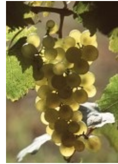
Pinot Blanc ou Klevner