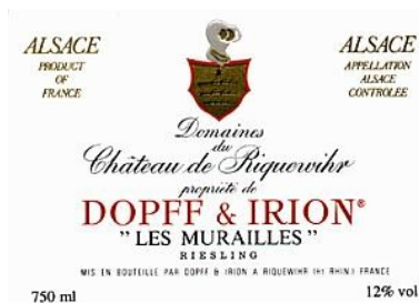
A.O.C. Alsace + lieu-dit (ex : Les murailles)