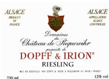
A.O.C. Alsace + nom de la commune (ex : Riquewihr)