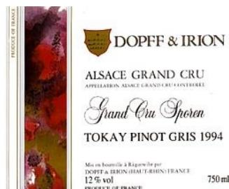
A.O.C. Alsace + Grand Cru Il s'agit d'une sélection des meilleurs vins après dégustation.