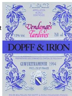
A.O.C. Alsace + Vendanges tardives (VT)

Cette appellation ne s'applique que pour les cépages nobles.