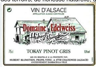
A.O.C. Alsace + nom du cépage

Il existe 3 appellations légales : A.O.C. Alsace , A.O.C. Alsace Grand Cru et Crémant d'Alsace , mais, la particularité de cette région est que le vin est commercialisé sous le nom de son cépage. Ces appellations peuvent également comporter un nom de marque ou la mention "Edelzwicker" pour un assemblage de plusieurs cépages blancs. L' A.O.C. Alsace Grand Cru est conférée à des vins satisfaisant à des contraintes de qualité particulièrement sévères, notamment en matière de délimitation des terroirs, de richesse naturelle, de dégustation d'agrément.