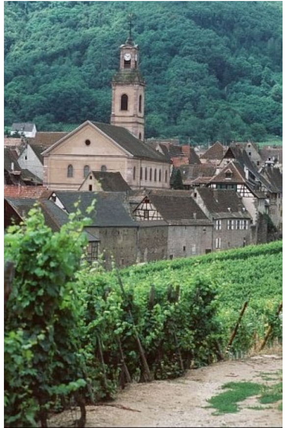
Figure 1 : Riquewihr